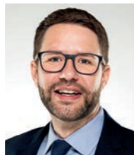
Landrat Thorsten Stolz